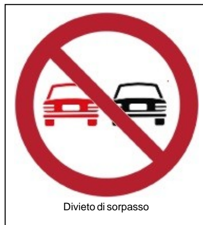
Divieto di sorpasso