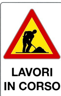
Lavori in corso